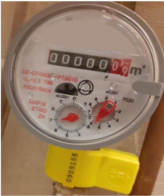
Sárga színű, sorszámozott biztonsági zárógyűrűvel ellátott lakás-mellékvízmérő