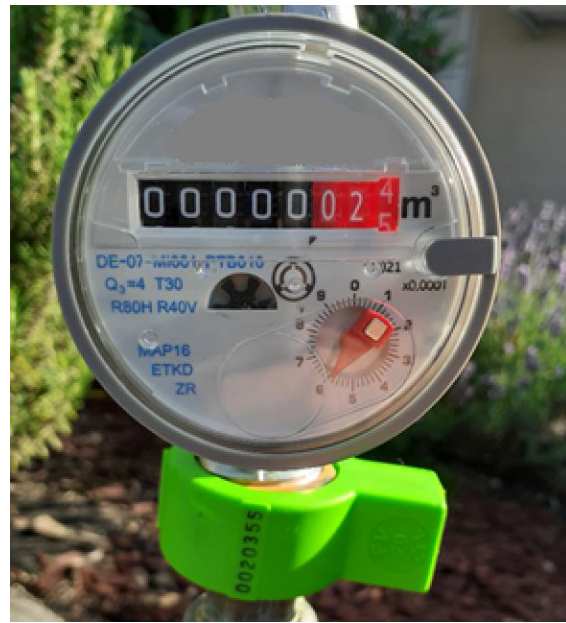
Zöld színű, sorszámozott biztonsági zárógyűrűvel ellátott locsolási célú mellékvízmérő