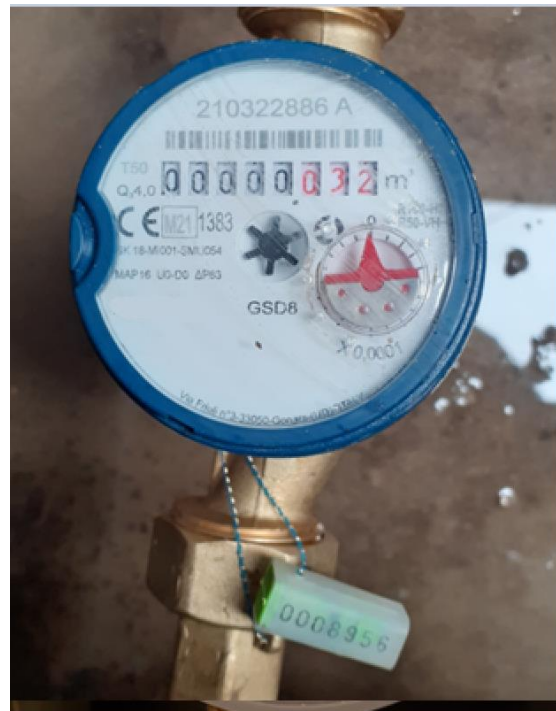
Zöld színű, sorszámozott, függő biztonsági záróelemmel ellátott locsolási célú mellékvízmérő